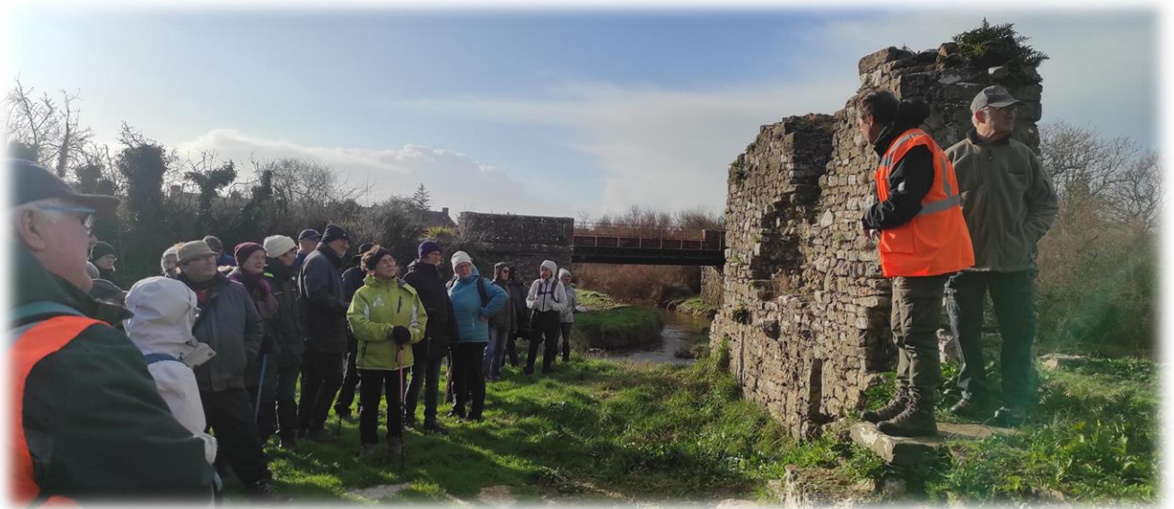
Le moulin de la mer