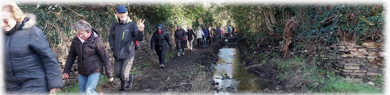
Chemin menant au moulin de la mer.