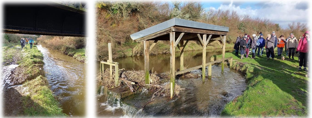
Chemin longeant la Gerfleur et passant sous le pont de chemin de fer menant au lavoir de la Mère Denis, quelque peu encombré.