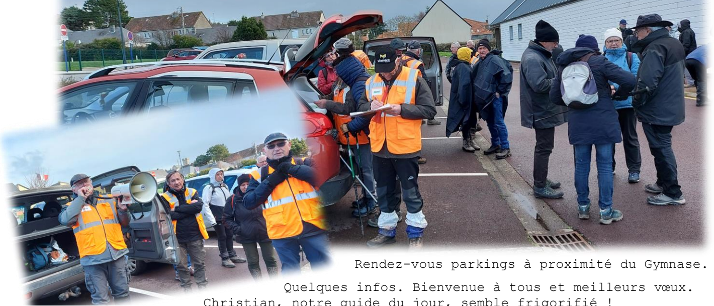
Rendez-vous parkings à proximité du Gymnase.